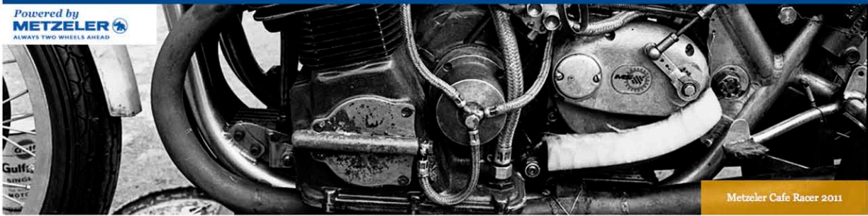
Metzeler Cafe Racer 2011

Powered by METZELER ALWAYS TWO WHEELS AHEAD