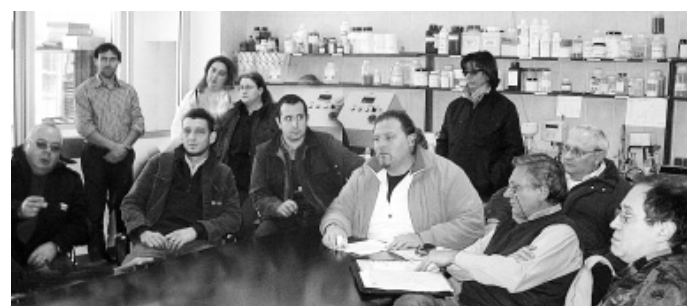
Un momento della conferenza stampa tenuta dalla RSU mercoledì